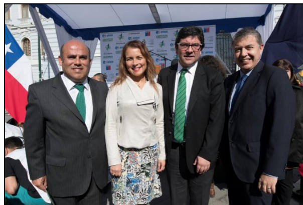
Representantes de Recyclápolis, Seremi y Ministerio de Medio Ambiente y Entel.