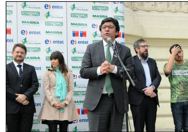
Pablo Badenier, Ministro del Medio Ambiente.