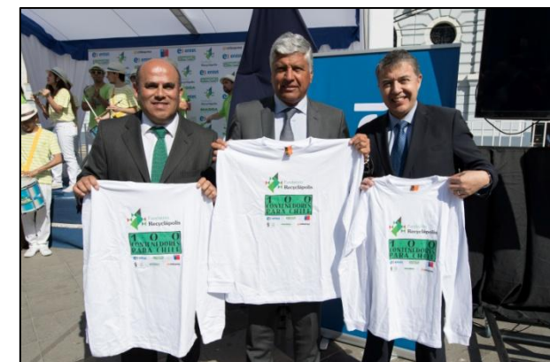
Representantes de Recyclápolis, Municipalidad de Valparaíso y Entel.