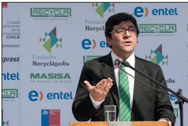
Pablo Badenier, Ministro del Medio Ambiente.